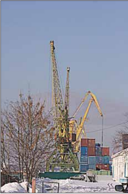
( . 26)