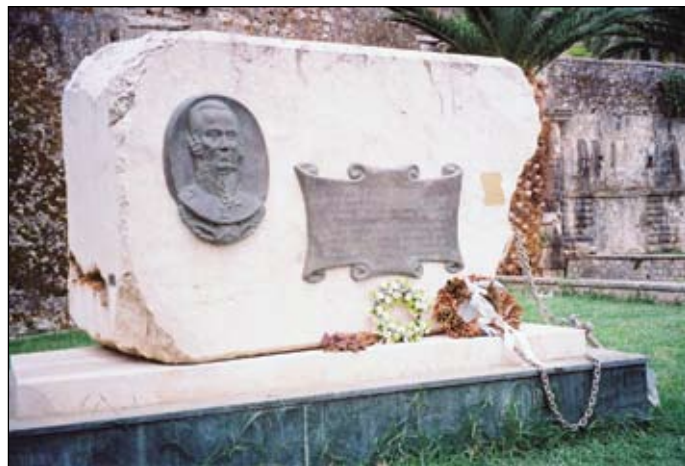
Керкира. Память об Ушакове в камне и в сердцах