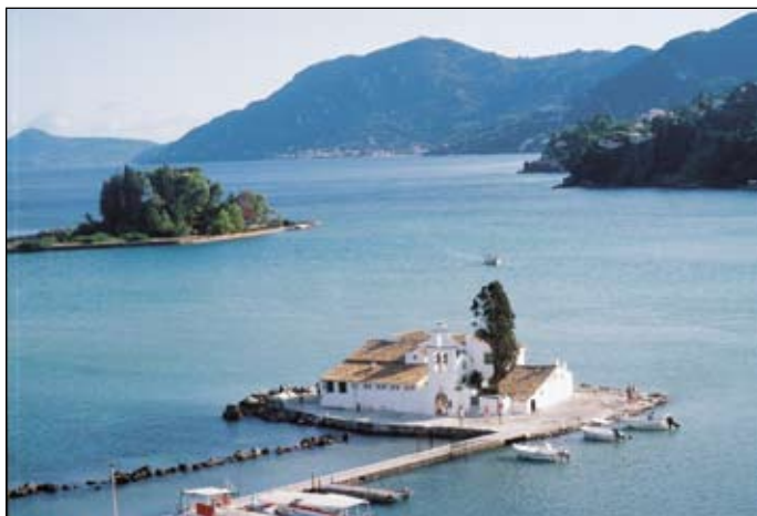
Греческий остров, которому русский адмирал принес свободу

А после возвращения в Санкт-Петербург его, в предчувствии новой русско-турецкой кампании, назначили на юг, в Херсон, где он должен был достроить корабль и выйти навстречу победам. Но тут на пути к ним встала всё уничтожающая в те времена чума.