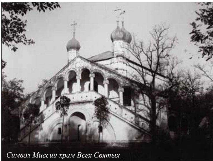
Символ Миссии храм Всех Святых

И все же исход из Китая был предрешен. Немало русских эмигрантов вернулось в Россию. Значительная часть уехала в Австралию и США. Судьбы и тех и других во многом сложились трагично. Однако их укрепляла вера, начало которой было положено православными пастырями в Китае. Патриарх Алексий I поставил перед Миссией новую задачу – способствовать рождению Китайской Православной Церкви с национальной иерархией и паствой. Началась тяжелая, кропотливая работа.