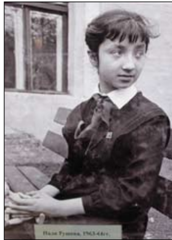
Надя Рушева. 1963 год

«Выставка рисунков Нади Рушевой в Свердловской картинной галерее. Открытие состоится 17 августа 1972 г. в 16.00»;