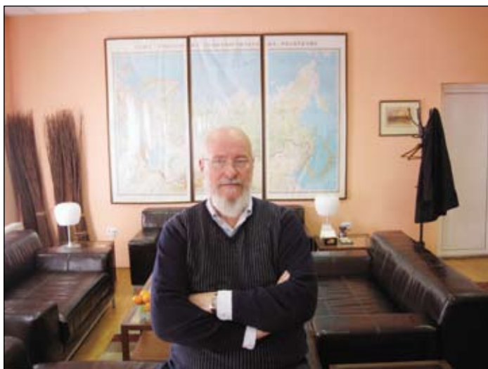
Офис в деревне