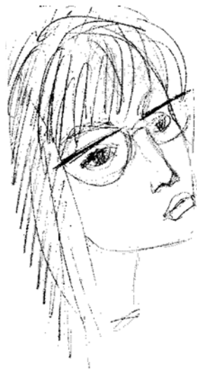
Автопортрет. 1967 год