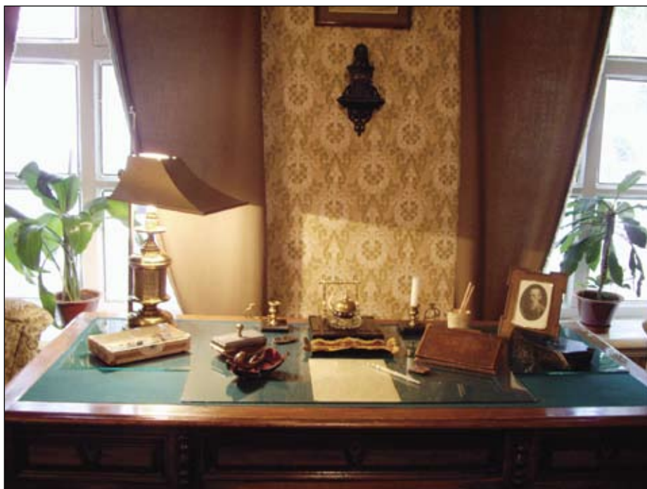
Рабочий стол писателя

Сейчас, когда миром правят лишь соображения «харча» (или «сырья» – в современной терминологии), самое время перечитать книги Дмитрия Наркисовича Мамина-Сибиряка. Пока от нашей планеты не осталась кучка перьев.