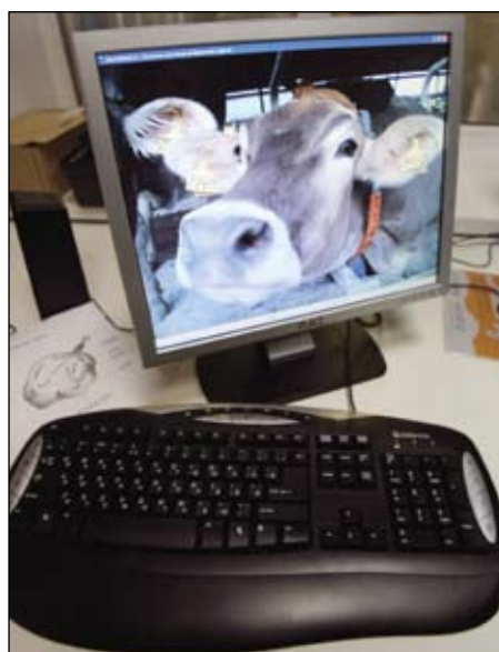
ТВ в коровнике – обычное дело в Крутове. Круто!