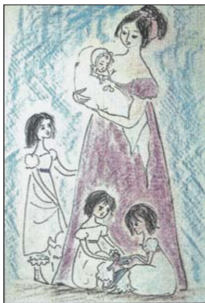
Наташа Ростова – счастливая мать