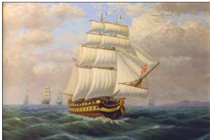
На линейном корабле «Святой Павел» адмирал Ушаков держал свой флаг