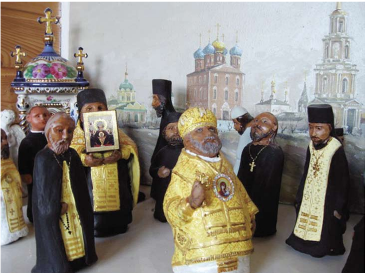
Монастырь – главный экспонат Музея

Побывав в Сказочном музее, мы наконец-то увидим фольклорного героя – Рязанского Косопуза, знаме-