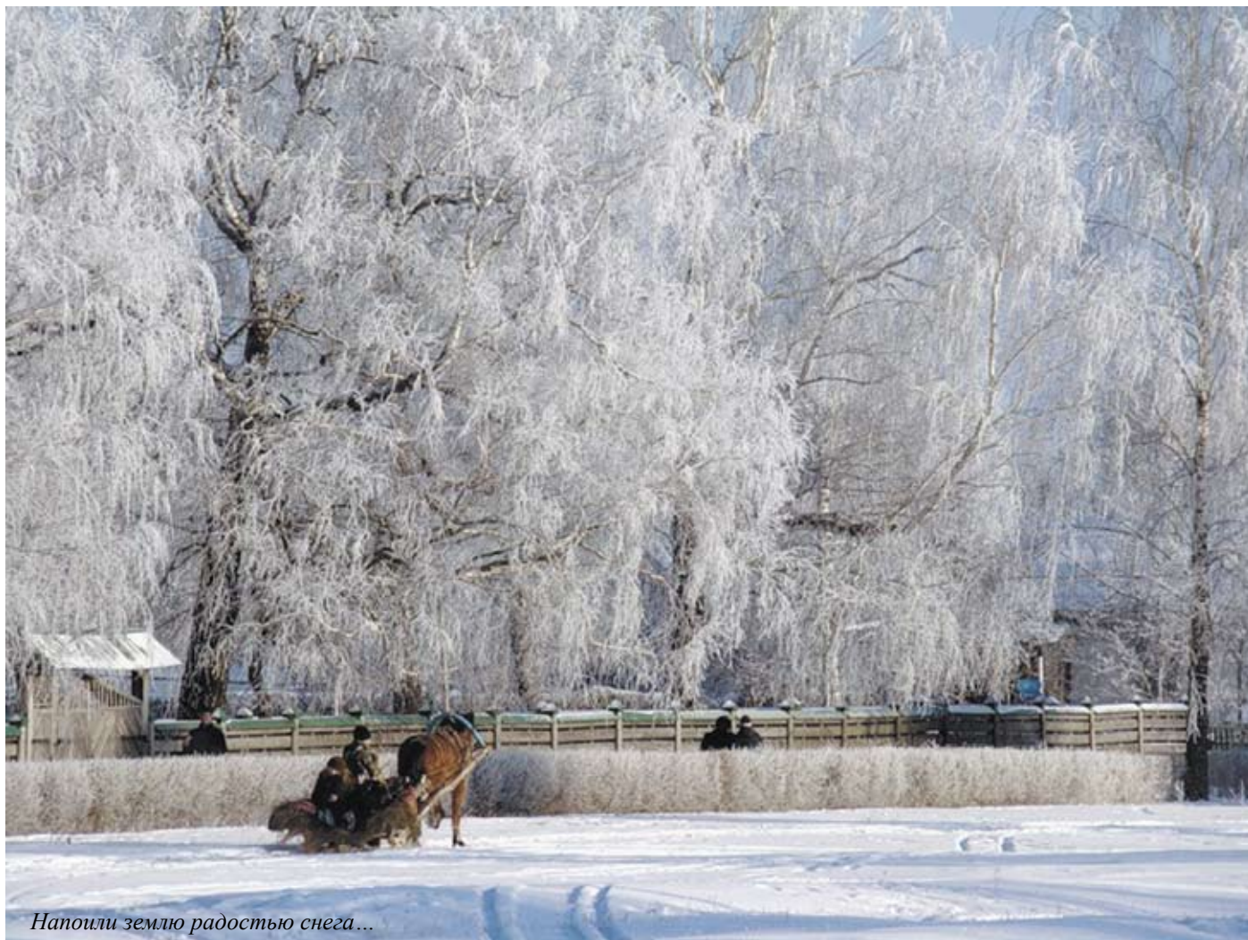
Напоили землю радостью снега...

неподалёку от села Константиново, на правом высоком берегу Оки.