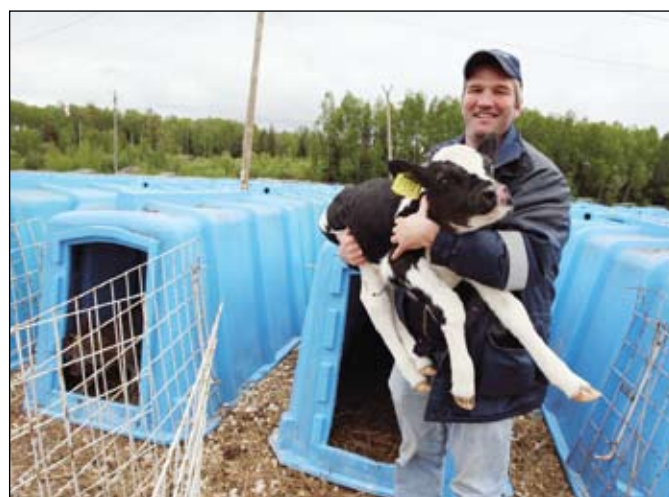
Сами понимаете, с кем

как кляла деревня свалившегося им на голову американца! Только-только объявились рабочие места, людям посулили хорошую зарплату, а некоторые ее даже не обмыли.