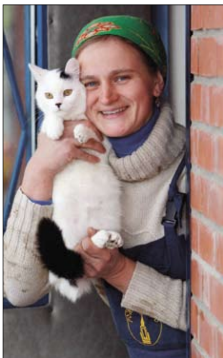
Здеиный Кот Матроскин