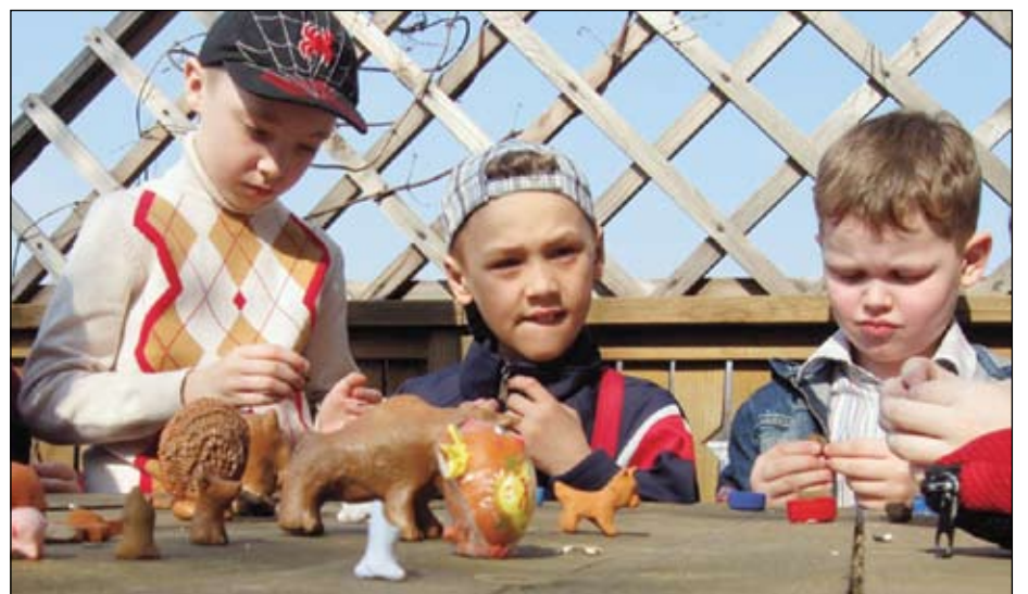
Дети и глина