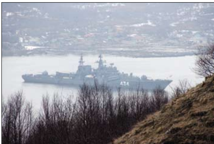
Современный эскадренный миноносец «Адмирал Ушаков»

Наступил не менее важный и ответственный период в жизни Ушакова. На островах – расколотое общество: аристократы-нобилы, «второклассные» – купцы, художники, юристы – и «мужики островные». Столкновения крестьян