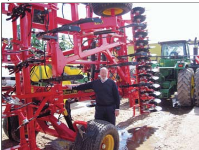
Обычная российская ферма