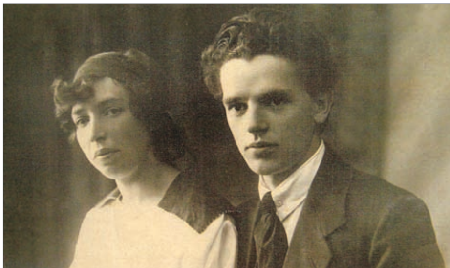
И его родители