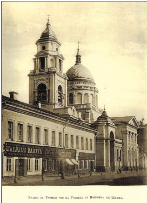
Век назад Москва была вот такой

иконостасы. Освящены все три престола. Храм получил копию иконы Богоматери «Трех Радостей» XIX в., ныне этот образ написан в византийском стиле. Каждый понедельник здесь совершается молебен грузинскому святому Давиду Гареджийскому, икона которого также попала в эту церковь.