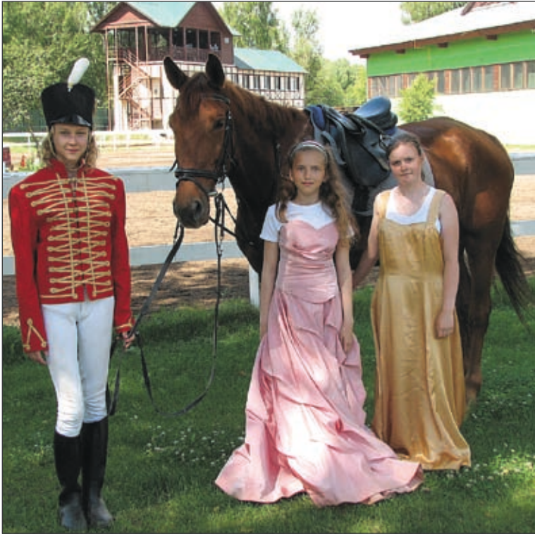
Театрализованные представления – обязательная часть учебной программы