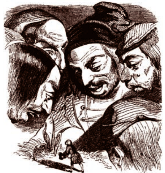
От грешков-карликов, кажется, можно отгородиться рукой, но когда они вырастают в грехи-гиганты, человек становится их рабом