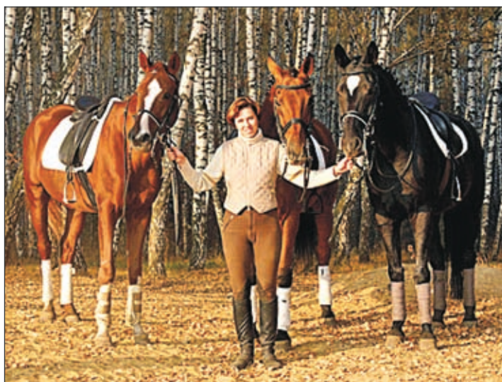
Директор всех лошадок

– Конный спорт, действительно, один из самых дорогих видов в мире. Но наша школа бесплатная. Мы не берем денег с родителей ни на одном из этапов тренировок: ни тогда, когда ребенок занимается начальной подготовкой, ни потом, когда он переходит в спортивную группу. Дети с ограниченными возможностями, естественно, тоже занимаются бесплатно. Город финансирует. Впрочем, отбор есть и у нас. Но он связан не с деньгами, а с тем, насколько серьезно дети и родители готовы относиться к занятиям, к лошадям, к дисциплине в школе. Например, когда мы проводим субботники, наши ученики вместе со своими мамами и папами обязаны явиться на уборку. Тем, кто не хочет помогать, придется менять