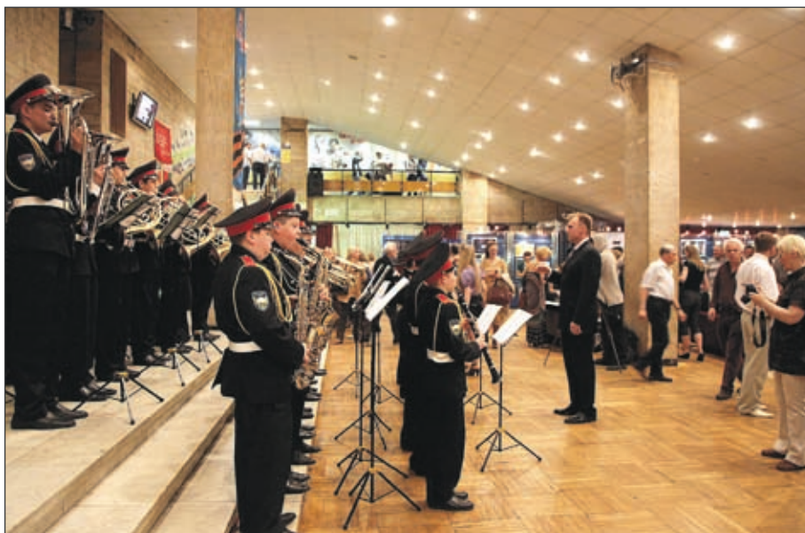
В дни Форума в Доме кино было многолюднее, чем на иных мировых премьерах

ФОРУМ: сцена. Своих зрителей порадовала и театральная программа, в которой были представлены 20 спектаклей – лауреатов международного театрального форума «Золотой Витязь» разных лет. Зрители уже не мыслят общения с искусством без ежегодных славянских премьер. Залы были полны! Камертон работы таких театров – в словах великого Щепкина: «Театр – это храм. Священнодействуй или убирайся вон!»