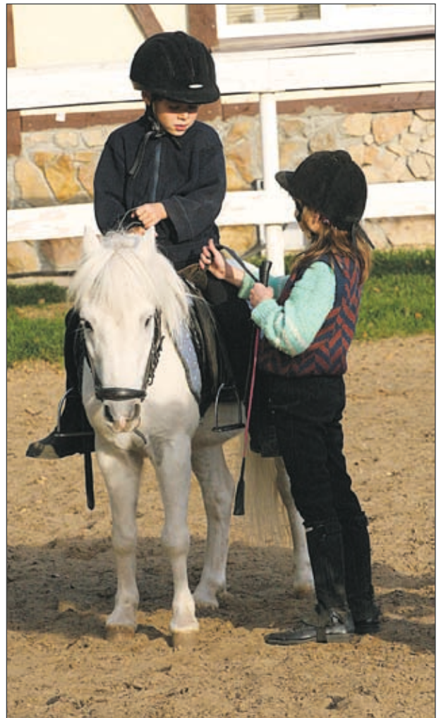
Умный Нельсон, хоть и на пенсии, продолжает давать мастер-классы в пони-клубе