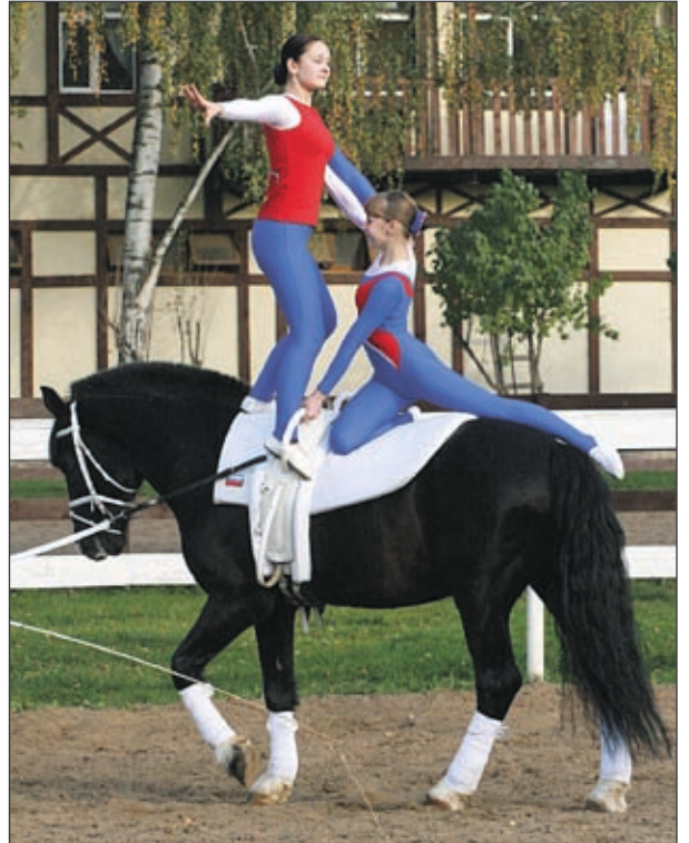
Вольтижировка – новый вид занятий у подростков