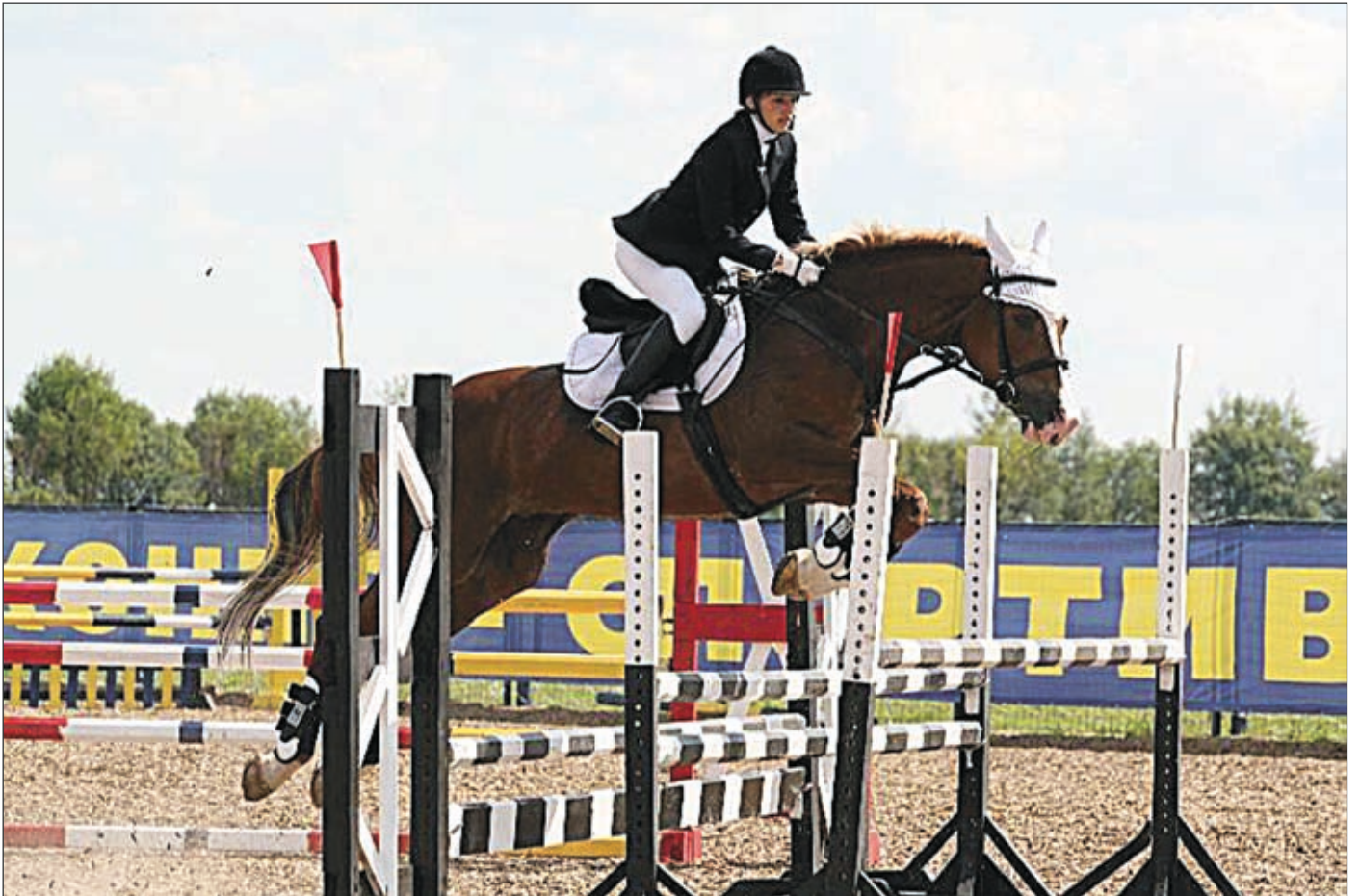
Конкур – преодоление препятствий