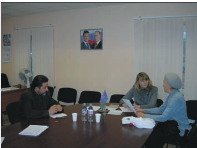
Депутатский прием в родном городе

– Оставим это психоаналитикам. Но ювенальная юстиция появилась именно по причине, которую я назвала. Наказа-