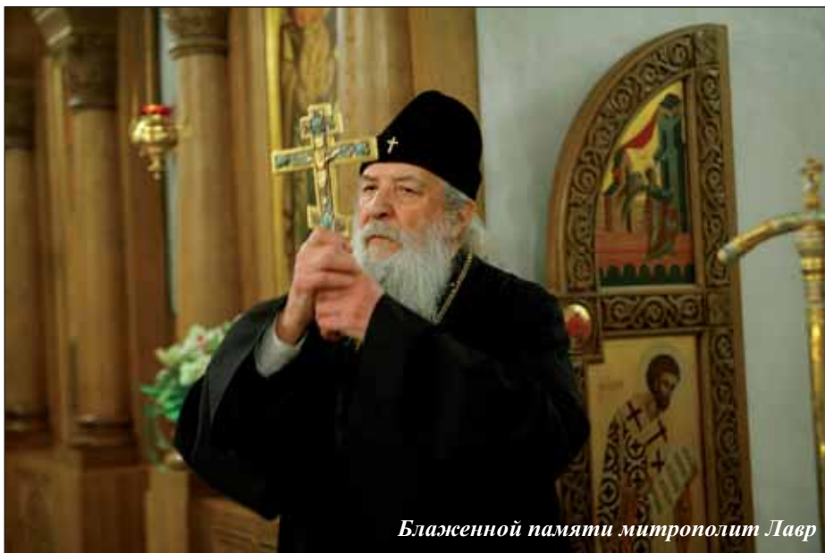
Блаженной памяти митрополит Лавр

стремятся паломники со всего света: частица Креста Господня, камень от Голгофы, частицы мощей Иоанна Крестителя, апостола Андрея Первозванного и многих других святых.