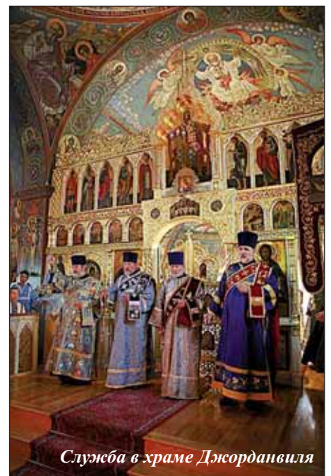
Служба в храме Джорданвилля

В монастыре собраны удивительные святыни, поклониться которым