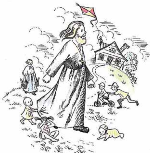
Рисунок Киры Скрипниченко