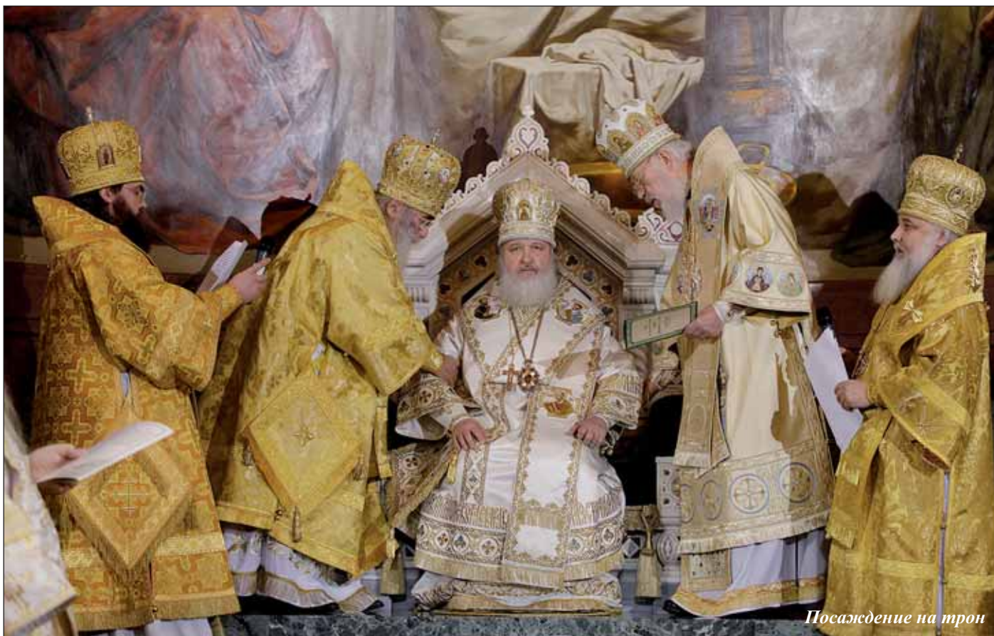
Посаждение на трон