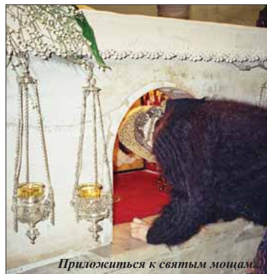
Приложиться к святым мощам.

Валерий Коновалов, специально для «Лампады», фото автора и В. Монастырёва