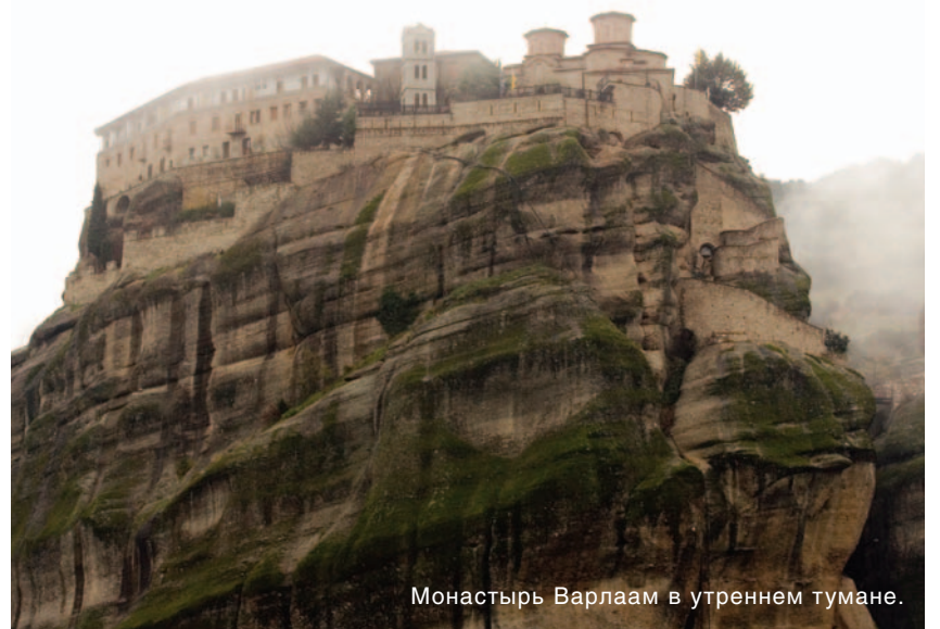
Монастырь Варлаам в утреннем тумане.