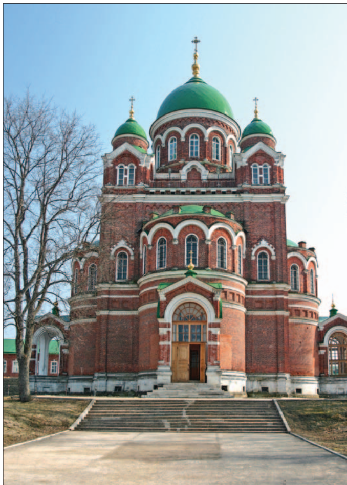
Собор в честь Владимирской иконы Божией Матери даже своими очертаниями напоминает, что он детище того же зодчего, что и Знаменский храм в Ховрине.