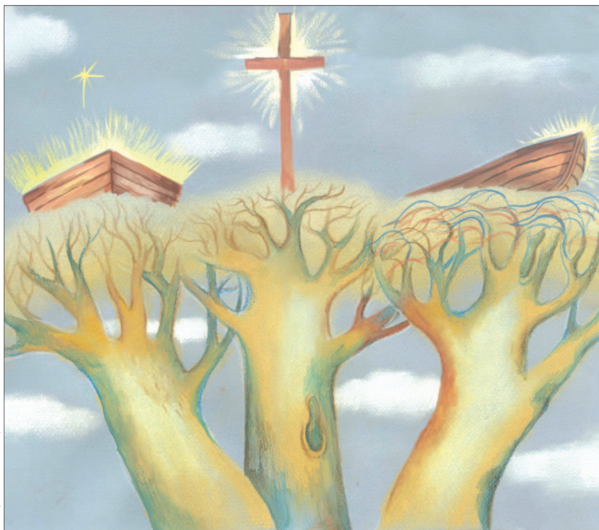
Рисунок Евгении Перепёлки.