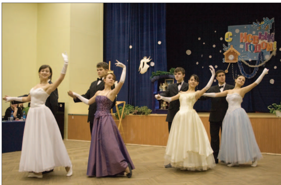
Бальные танцы XIX века в исполнении учащихся театральных классов.