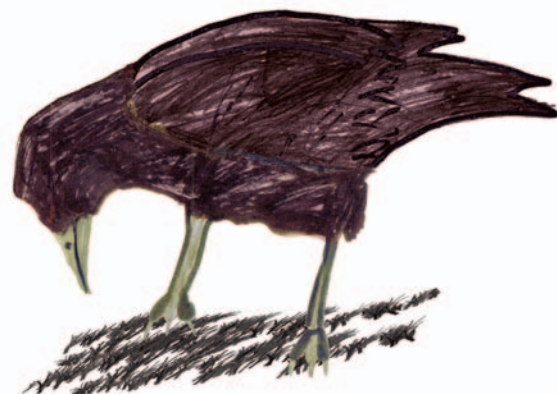
Рисунок Иустины Ефановой.

Этот день впереди, А пока погляди, Как под звон великопостный Ходит пашней грач серьёзный, Ходит чинно взад-вперёд, Не спеша поклоны бьёт.