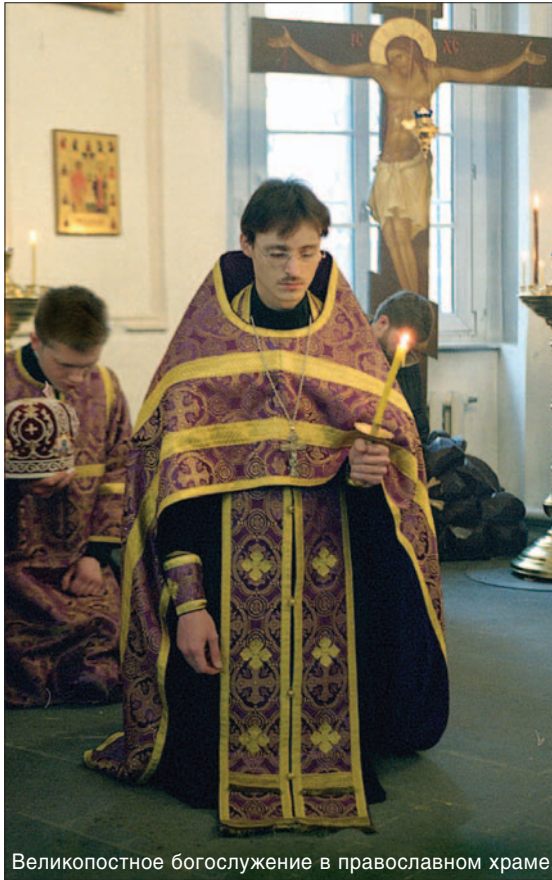
Великопостное богослужение в православном храме.