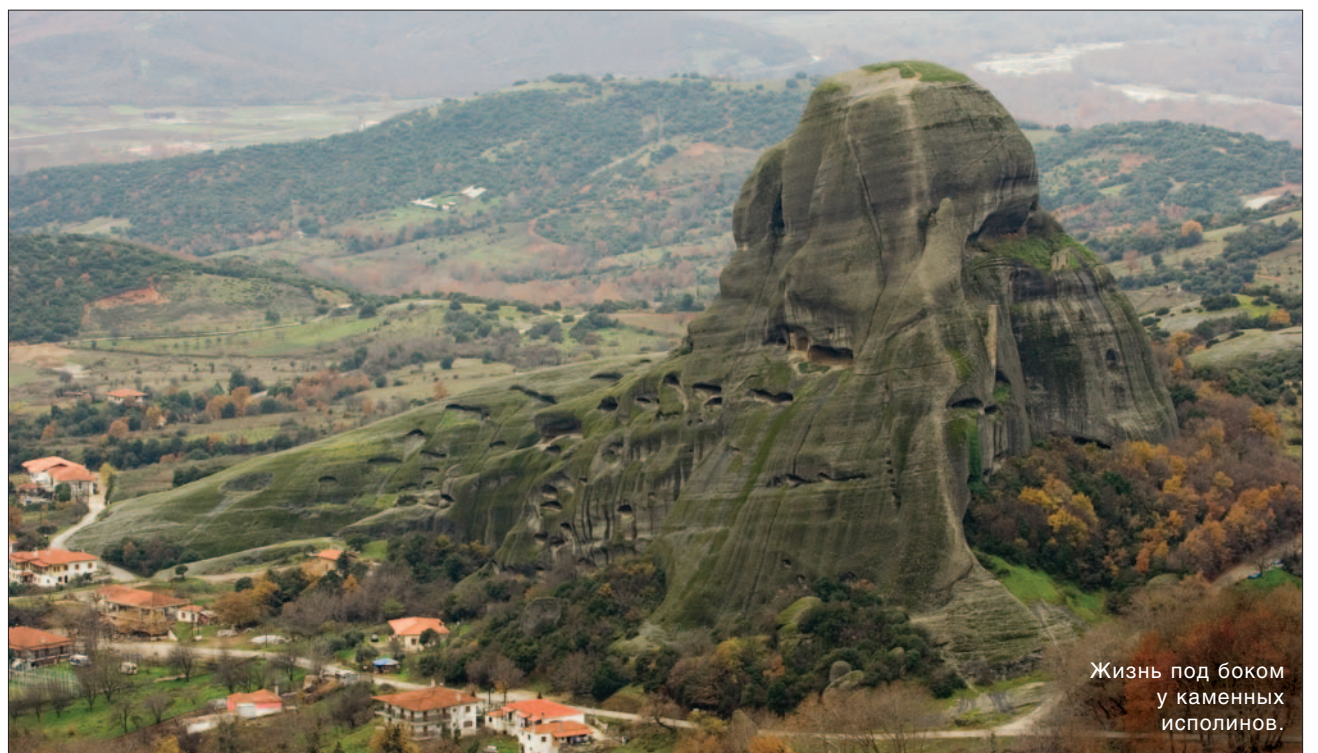
Жизнь под боком у каменных исполинов.