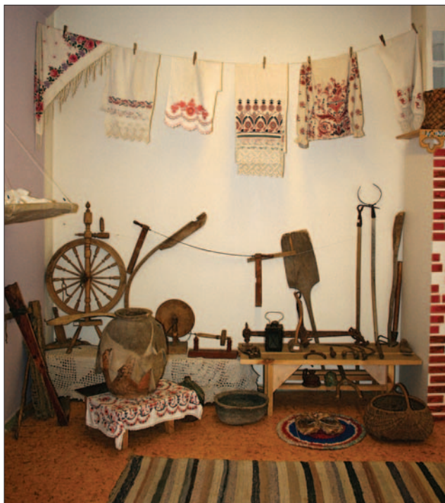
Фрагмент интерьера музея быта.