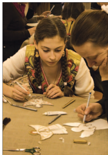
Мастер-класс по изготовлению рождественских ангелов в технике бумагопластики.