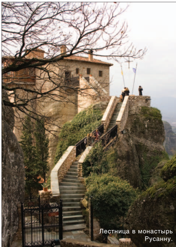
Лестница в монастырь Русанну.