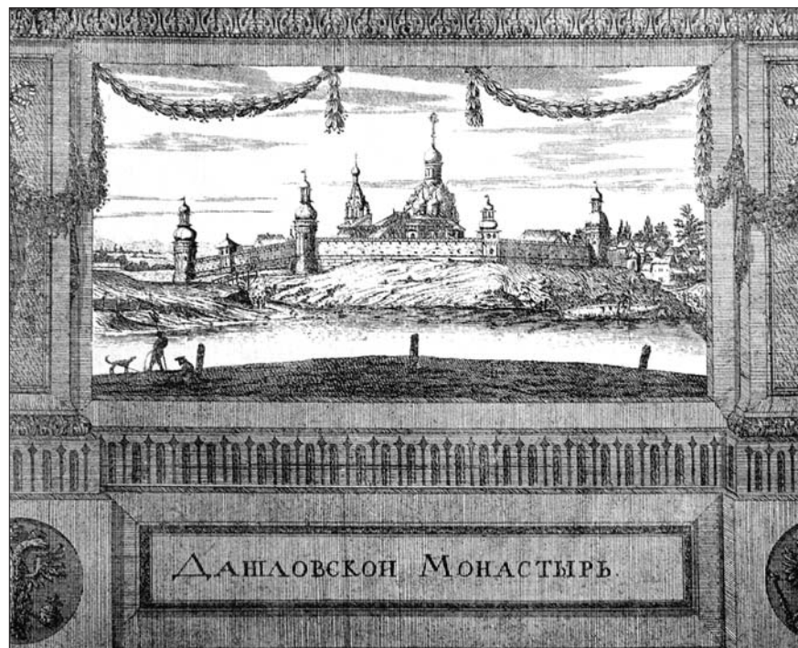
Данилов монастырь в начале XVIII века.

Воспоминания автора сопровождаются родословным и биографическим очерком «Слово об отце и деде», написанным его сыном