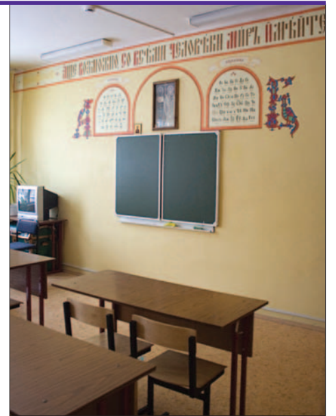
Кабинет истории письменности.

В тот день нам выпала редкая возможность не только внимать