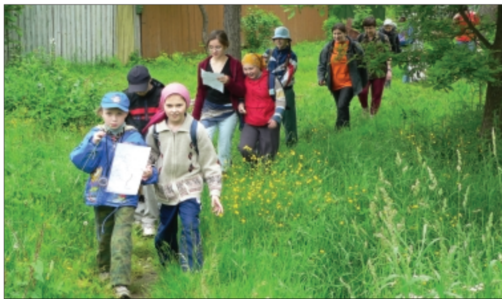
Куда мы идем?

Экспедиция не затянулась, и вскоре ребята достигли конечного пункта пути – источника. Победителя определила эстафета, но, конечно, поощрительные призы достались всем ребятам. Выигравшая команда получила походные фляги для воды, а проигравшая термкружки из нержавеющей стали. Этими же кружками им пришлось наносить два котелка (всего около 20 литров) воды для чая из источника, который находился в 300 метрах от привала.