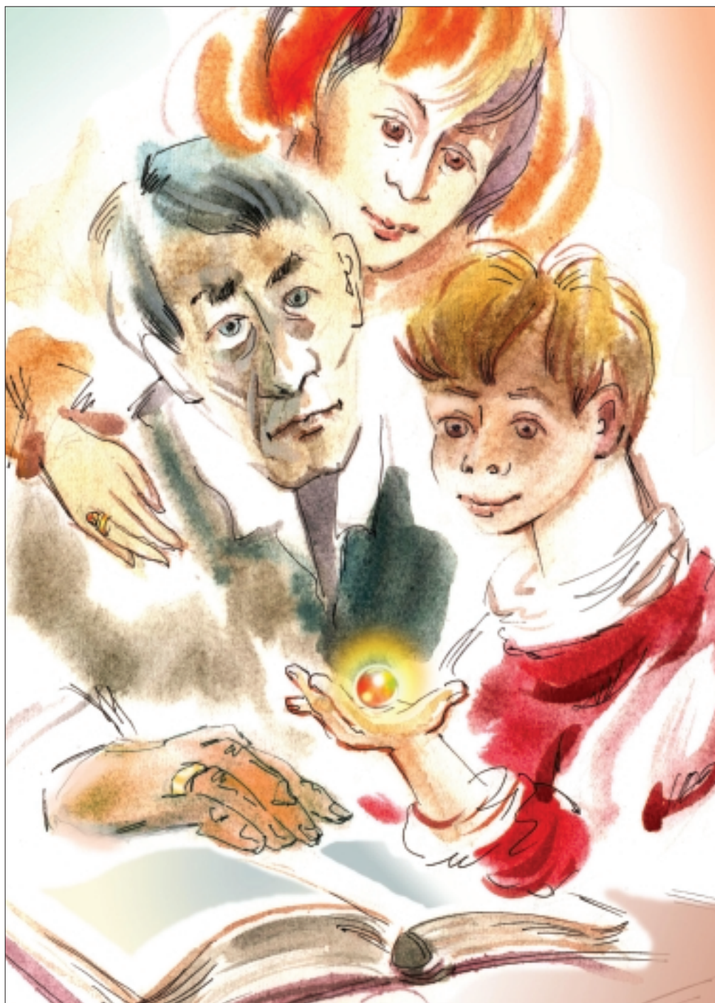
Рисунок Леониды Большакова