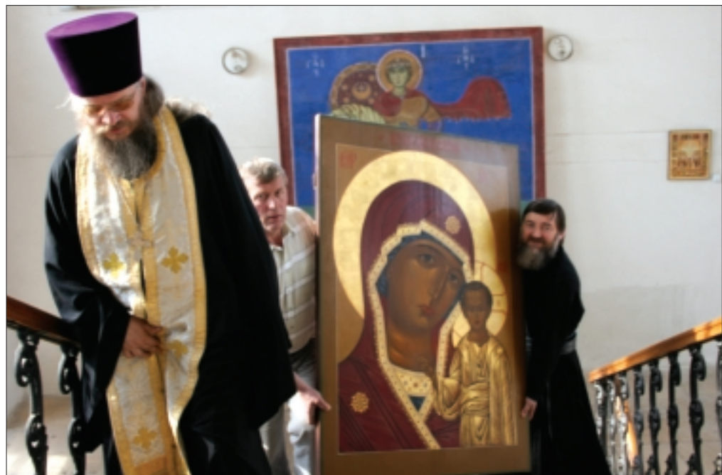
Перенесение образа Божией Матери «Казанская» в храм Воскресения Христова в Кадашах

(В статье использованы материалы сайта православного прихода храма Воскресения Христова в Кадашах www.kadashiri.ru )