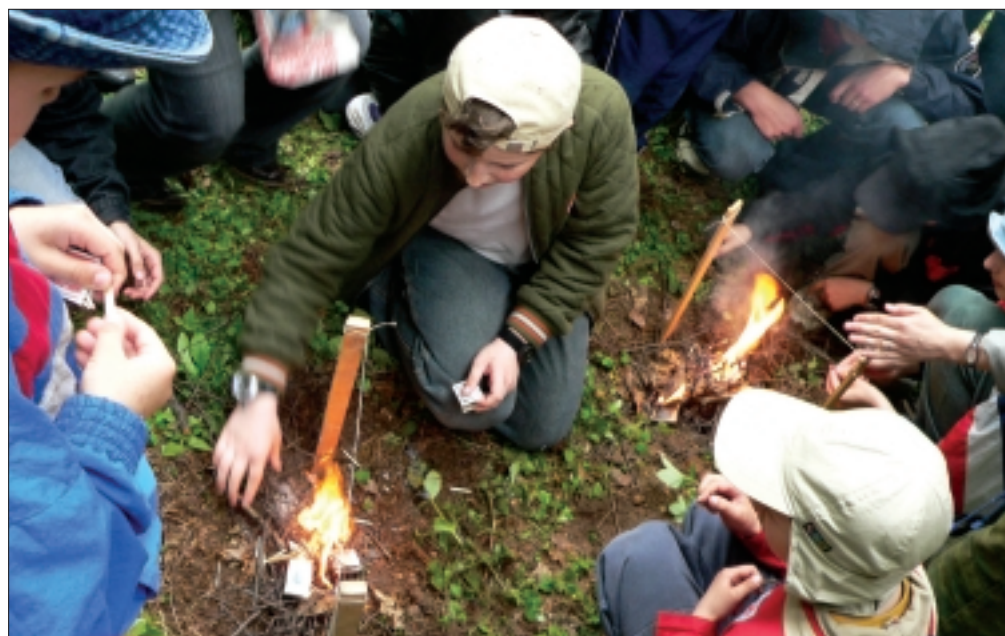
Огонь коснулся нити, но мы проиграли

Завершая наш рассказ, хочется сказать вам, дорогие маленькие христиане, что наша жизнь – тоже экспедиция или поход в далекую страну Царствия Божия. Дойти до него, победить можно только сообща, вместе, когда каждый друг другу помогает, любит своего ближнего и страдает ему. Наша Экспедиция продолжается.