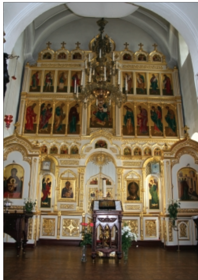
Иконостас храма во имя преподобного Сергия Радонежского

Редакция газеты «Лампада» поздравляет прихожан, клириков и настоятеля храма во имя преподобного Сергия Радонежского с престольным праздником и желает им многая и благая лета!