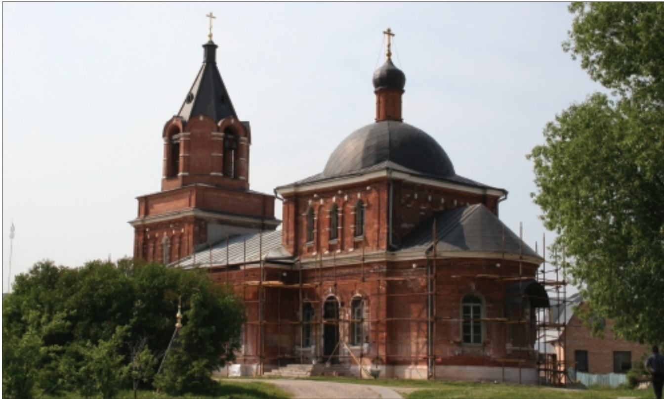
Вид на храм во имя преподобного Сергия Радонежского в Бусинове

18 июля Православная Церковь празднует обретение честных мощей преподобного Сергия, игумена Радонежского, всея России Чудотворца. Каждый год в этот день прихожане Знаменской общины идут крестным ходом из Ховрина в Бусиново, чтобы помолиться в храме, носящем имя великого святого земли Русской.