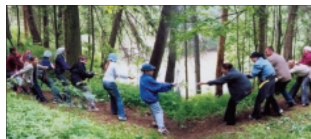
Дети против взрослых