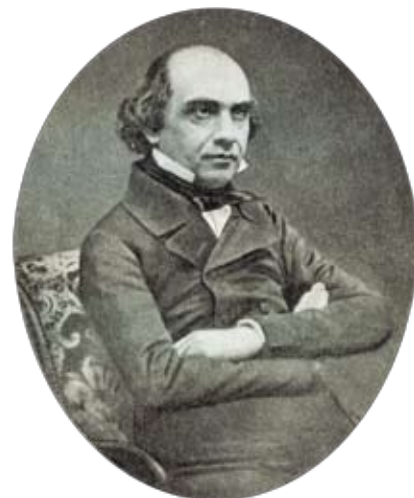
Т.Н. Грановский. Дагерротип . 1830-е