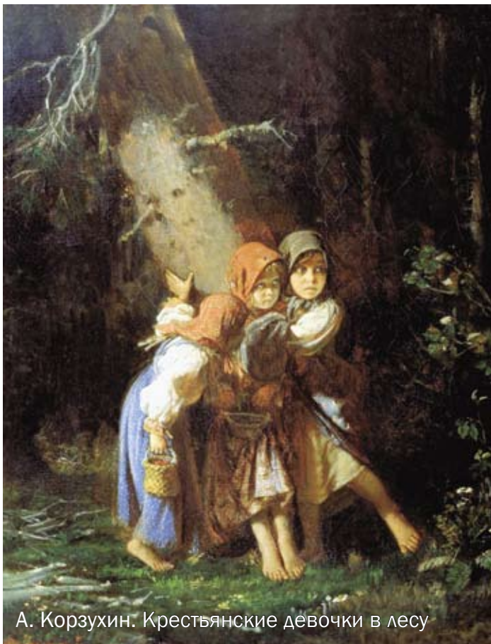
А. Корзухин. Крестьянские девочки в лесу