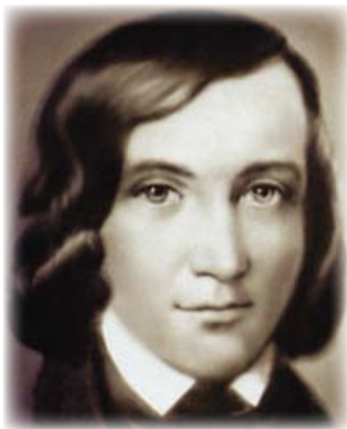
Н.В. Станкевич. Акварель Л. Беккера. 1838

Именно Станкевич привлек внимание членов кружка к философскому познанию действительности, считая, что научное познание – не самоцель, а основа для «постройки жизни». Он стал для своих товарищей (которых он называл «братия») учителем и оказал большое влияние на их дальнейшее идейное и творческое развитие. На-