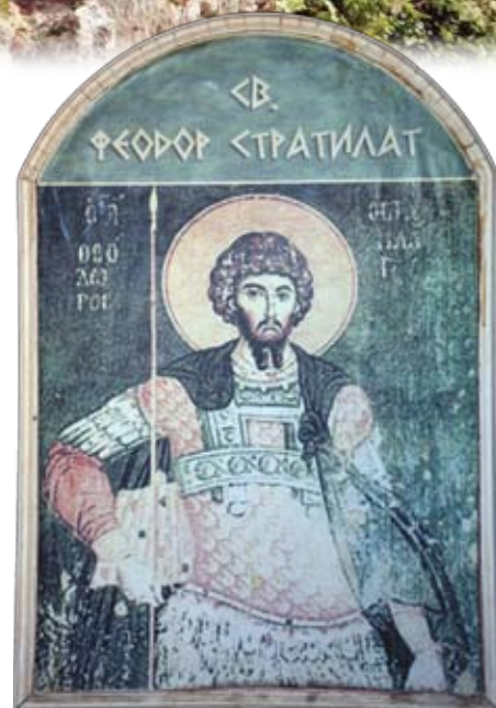
Икона св. Феодора Гавраса Стратилата в феодоритской крепости Фуна

В конце XI века святой Феодор Гаврас делает богатые приношения известным понтийским монастырям Вазелонас и Панагия Сумела. Не пожалел он денег и на строительство женского монастыря Святой Троицы, названного после его гибели монастырем Святого Феодора Гавраса Стратилата. Предположительно в 1098 году Феодор Гаврас попал в плен к сельджукам. За отказ принять чужую веру он был жестоко