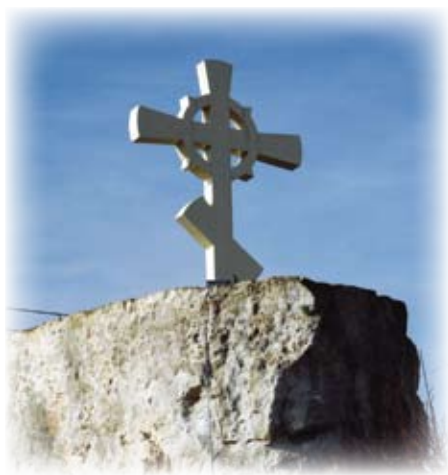
Поклонный крест в Инкермане. Севастополь

Деятельность любого правителя во многом зависит от того духовного наследства, которое он получил от своих родителей и близких родственников. Говоря современным языком, от той духовной и психологической атмосферы, которая с детства окружает человека в его родной семье. Будущий креститель Руси был сыном великого князя Киевского Святослава Игоревича – князя-воина, князя-завоевателя, самого, пожалуй, яркого и заметного героя нашей первоначальной истории. Но при этом детские годы князя Владимира нельзя назвать счастливыми и безмятежными. Дело в том, что мать Владимира была незнатная женщина по имени Малуша – ключница, иначе – домоправительница. А по законам Древней Руси человек такого социального положения оказывался в положении раба своего господина. Так что происхождение Владимира Святославича не могло не наложить отпечаток на всю его судьбу.