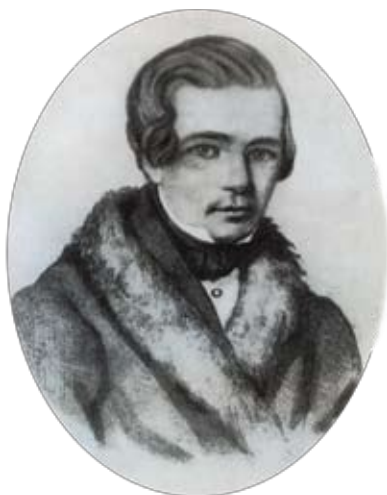
А.В. Кольцов. Портрет работы К.А. Горбунова. 1840-е

И радужной блестит тот мир одеждой, Им блеск небес как будто отражен; Все дышит в нем любовью и надеждой, Он верою, как солнцем, освещен.