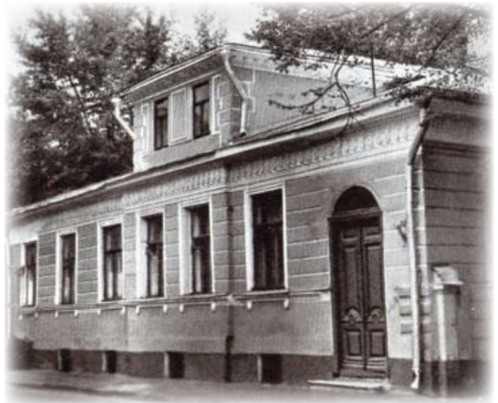
«Дом Станкевича» в Москве (дом № 8 в Большом Афанасьевском переулке), где в 1836–1837 годах жил Н.В. Станкевич. Здесь неоднократно бывали В.Г. Белинский, М.А. Бакунин, К.С. Аксаков и другие участники кружка