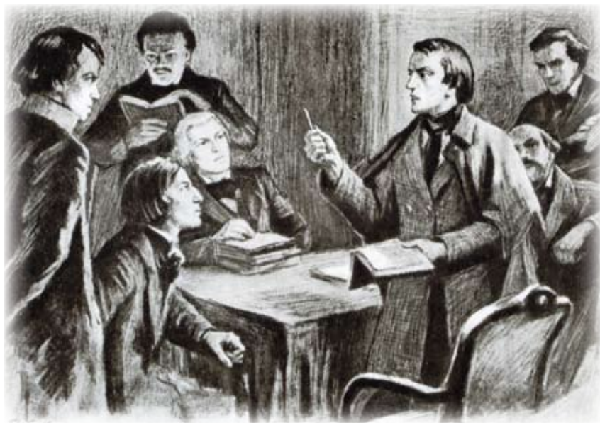
В кружке Н.В. Станкевича. Рисунок Б.И. Лебедева. 1940-е

единство с нею?» 16 ; «Кто бескорыстно ищет истины, тот уже очищает душу и готовится к принятию божества. Царство истины – царство Божие; оно в мире, но не от мира» 17 .