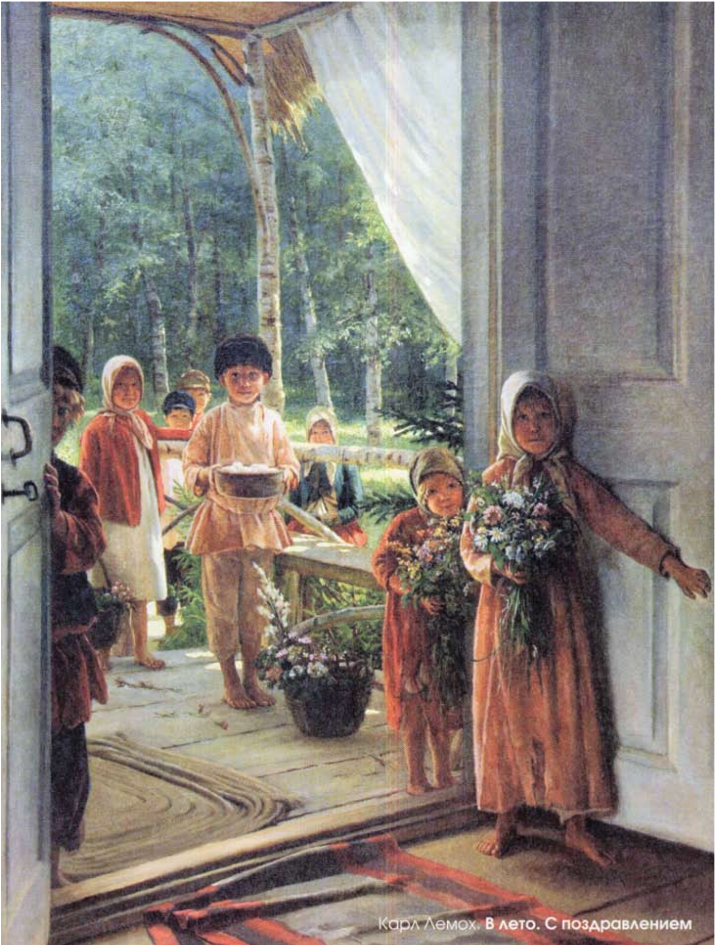
Карл Лемох. В лето. С поздравлением