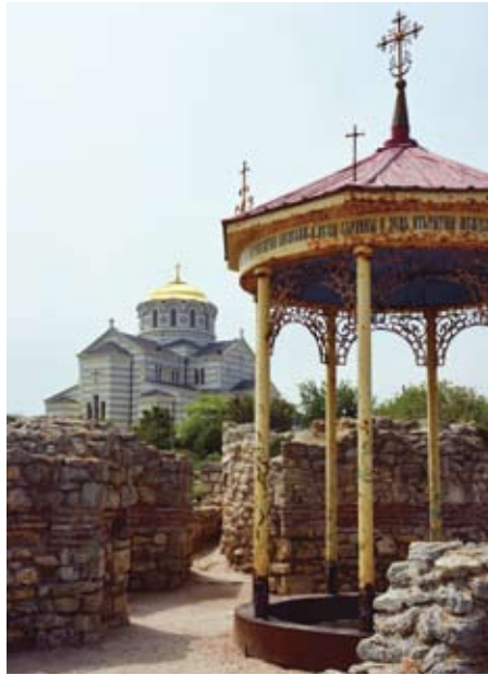
Часовня на месте, где, предположительно, крестился князь Владимир. На заднем плане – Владимирский собор

А произошло вот что. С 976 года в Византийской империи правили вместе два брата – Василий II и Константин VIII. Старший (Василий) производил впечатление человека деятельного и целеустремленного, младший (Константин), напротив, казался беззаботным прожигателем жизни. За годы