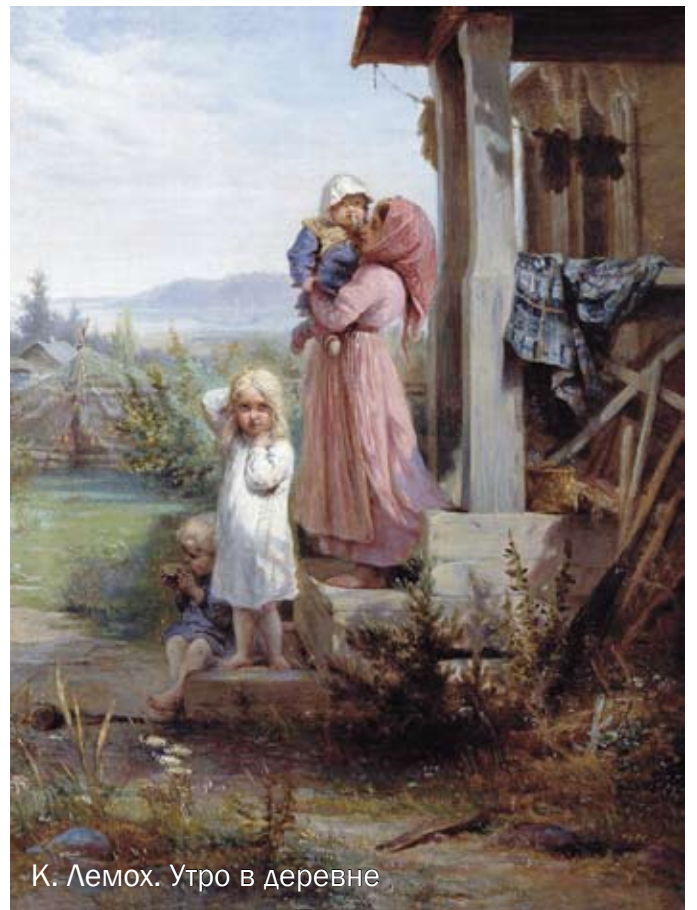
К. Лемох. Утро в деревне