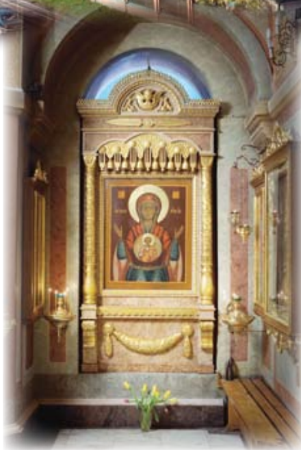
Главный образ храма иконы Божией Матери «Знамение» в Ховрине