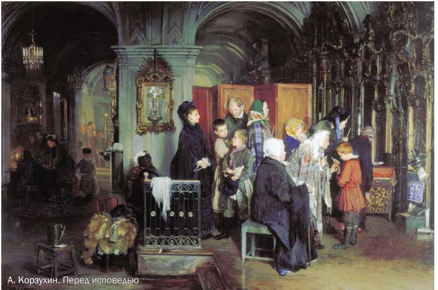
А. Корзухин. Перед исповедью