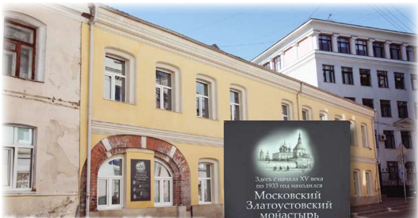
Малый Златоустинский переулок, дом 5. Все, что сохранилось от монашеской обители