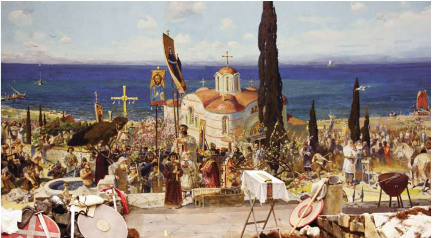
Крещение войска князя Владимира в Херсонесе. Фрагмент диорамы художников П.В. Рыженко и А.М. Самсонова

Владимира: князь принял новую веру уже не только на словах, но и на деле. Роль, которую сыграла Корсунь в жизни князя Владимира и в христианизации всей Руси, была огромной. Ведь именно взятие Корсуни действительно привело к очевидному для всех перерождению нашего героя. Он выступил из Киева одним человеком – исполненным гнева, жаждущим отмщения,